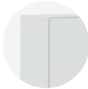
Madera de densidad media MDP