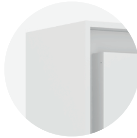
Madera de densidad media MDP