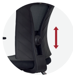
Soporte Lumbar Regulable